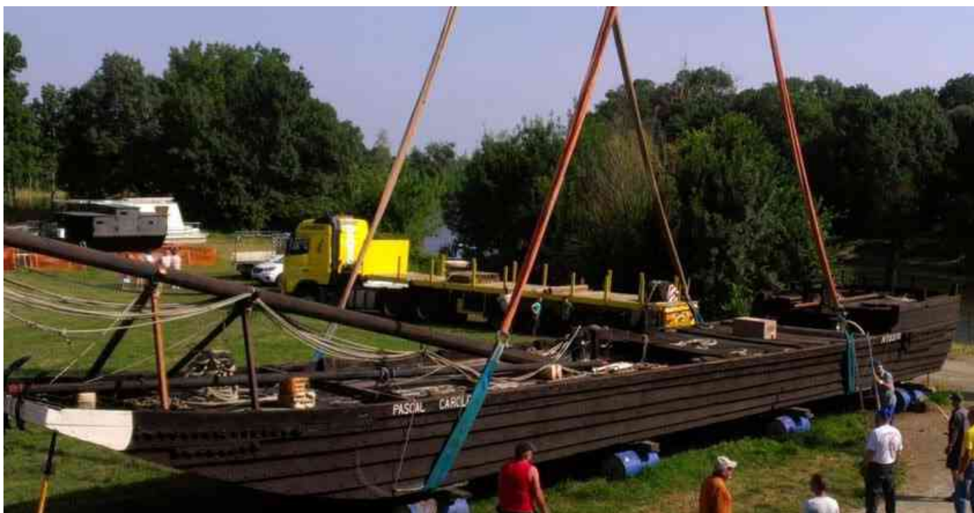
Remise à l'eau de la gabare Pascal Carole en 2013.

Notre gabare a aujourd'hui besoin d'une bonne remise en forme avant de reprendre son travail sur la Loire. Cela nécessite dans un premier temps de la ramener de Saumur puis de la remettre dans les mains expertes d'un charpentier de marine afin qu'elle retrouve sa superbe allure.