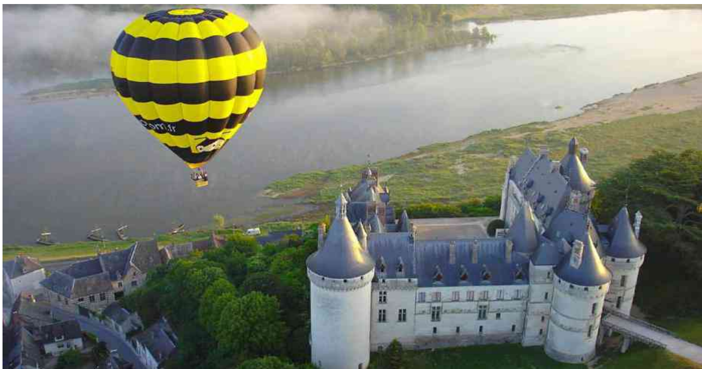
Le château de Chaumont-sur-Loire et la Loire.