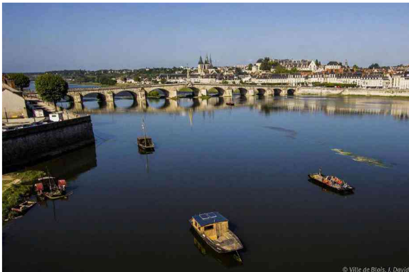
La Loire à Blois.